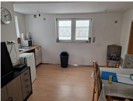
20240404_135821 – Kopie - Kopie.jpg