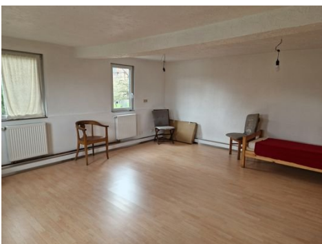
20240404_135908 - Kopie.jpg