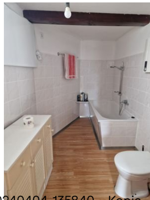
20240404_135840 – Kopie (2).jpg