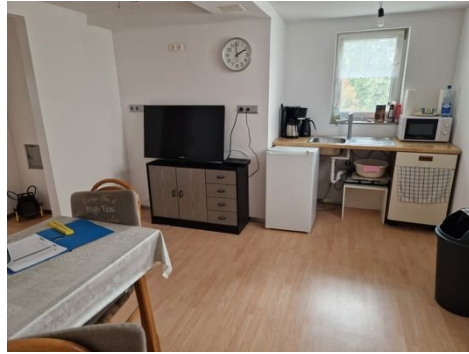
20240404_135834 – Kopie - Kopie.jpg