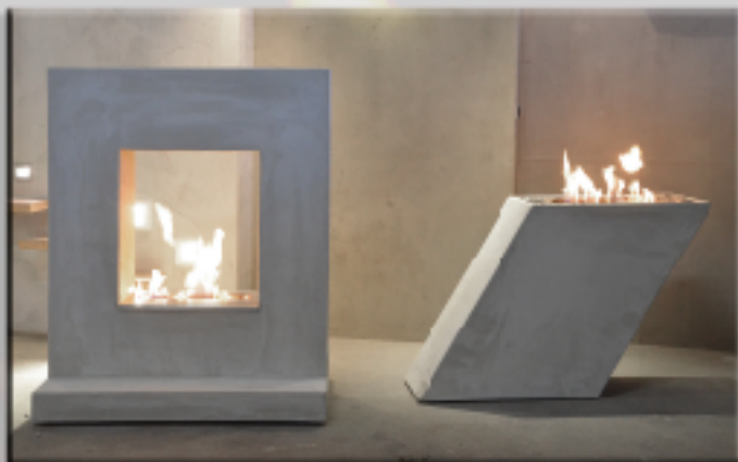
Die BioEthanol-Kamine erhalten Sie auch mit Schutzglas

Wir bauen für Sie, ganz nach Ihren Vorstellungen, die schönsten BioEthanol-Kamine, nach TÜV-Norm 4734. In BetonART, SteinART, SchieferART, SandsteinART u.v.m.