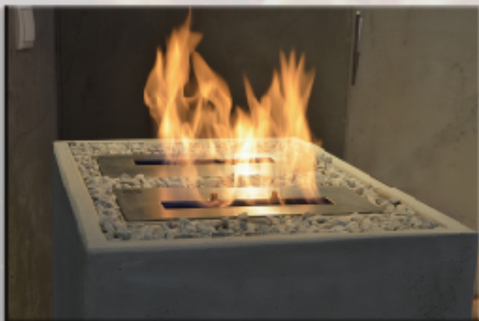
Sicherheits-Brennkammern nach TÜV-Norm 4737