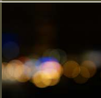
Christoph Geisel www.teamhighcontrast.de H

>> Meine Welt ist zur Zeit experimentierfreudig: mal bunt, mal sanft, mal satt, mal unverhofft, mal laut, mal leise, manchmal nur flüchtig, meistens grün<<