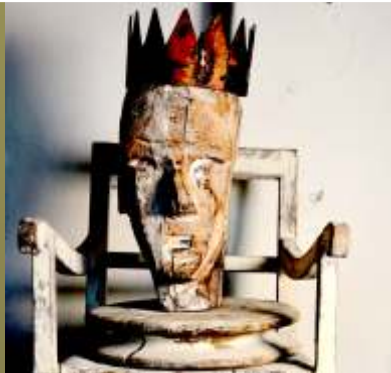
Richard W. Allgaier www.allgaierart.de D

>> Meine Welt ist die, der Reisen, in innen und außen. Ein Beobachter, Übersetzer auf dem künstlerischen Weg, der nie endet...<<